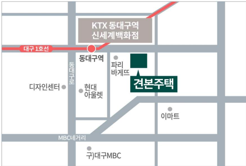
건본주택 : 대구광역시 동구 신천동 385-1번지