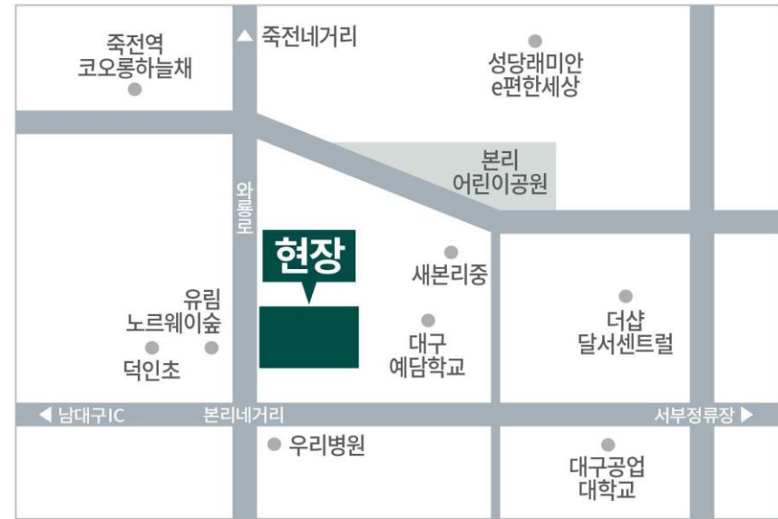
현장 : 대구광역시 달서구 본리동 358-5번지